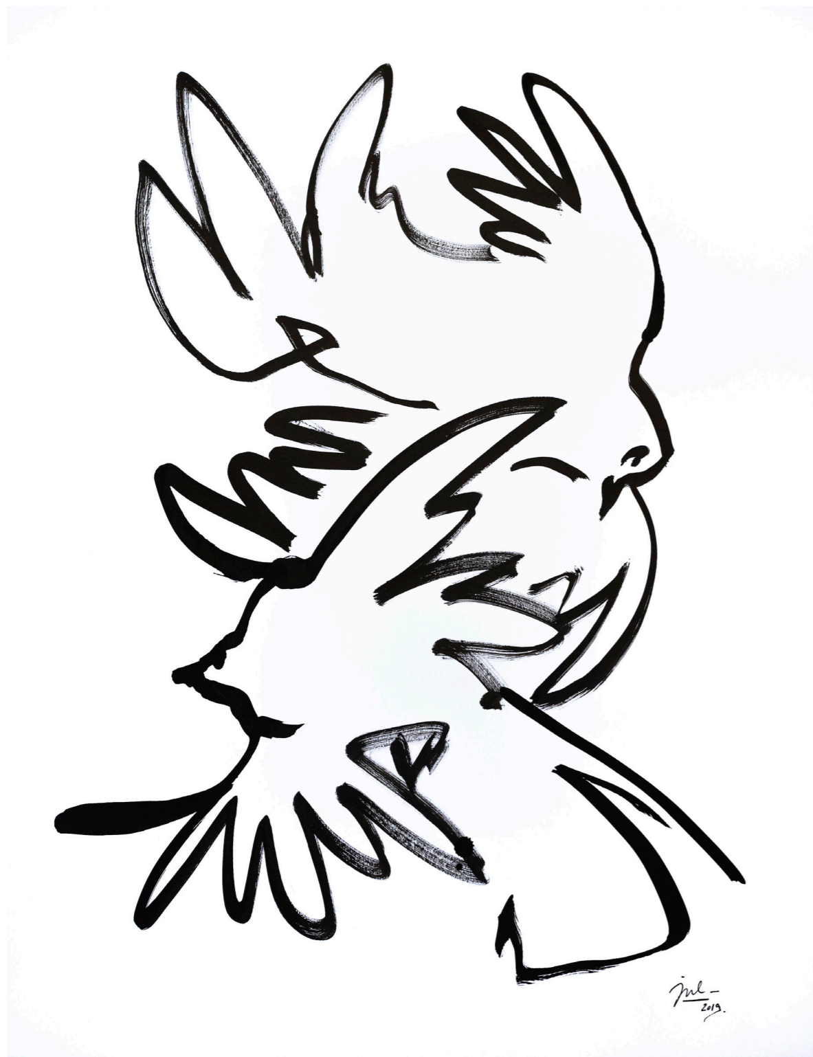
Deux colombes qui dansent, Encre de Chine sur papier, 80x60 cm, 2019.