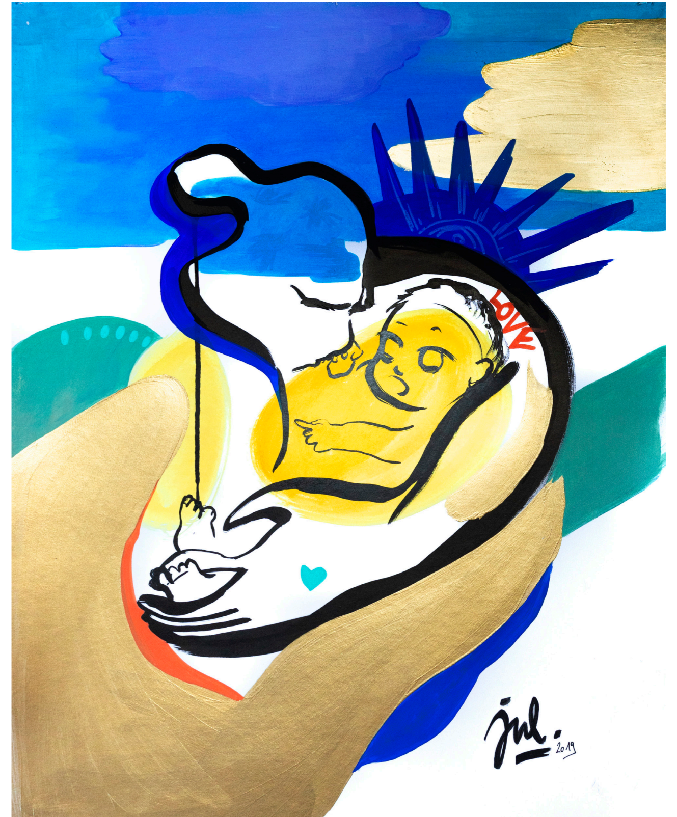
Maternité "Statue de la Liberté", Encre de Chine, acrylique et gouache sur papier, 80x60 cm, 2019.