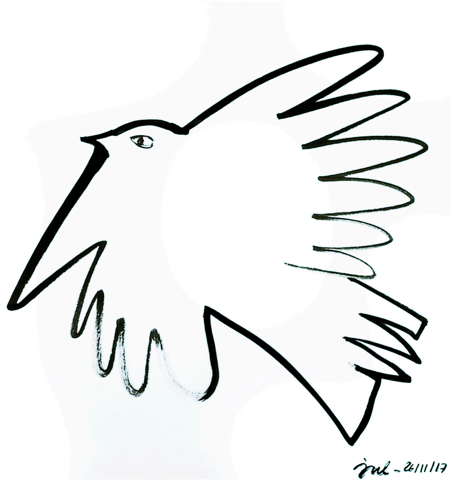
Colombe "Picasso", Encre de Chine sur papier, 40x40 cm, 2017.

* Dans l'œuvre de J.M. Barrie, Peter Pan , le jeune Peter a la capacité de voler dans les airs. Pour cela, il mobilise une pensée agréable et se défait de tous ses problèmes. C'est pour moi une image de liberté absolue qui lui donne des ailes. Bien que sans mémoire et sans attaches, (sans amour, même ?) ce personnage hors du temps soit presque désincarné et effrayant, l'image de la pensée qui fait décoller m'inspire. Et en guise de poussière de fée, les pigments dorés font parfaitement l'affaire !