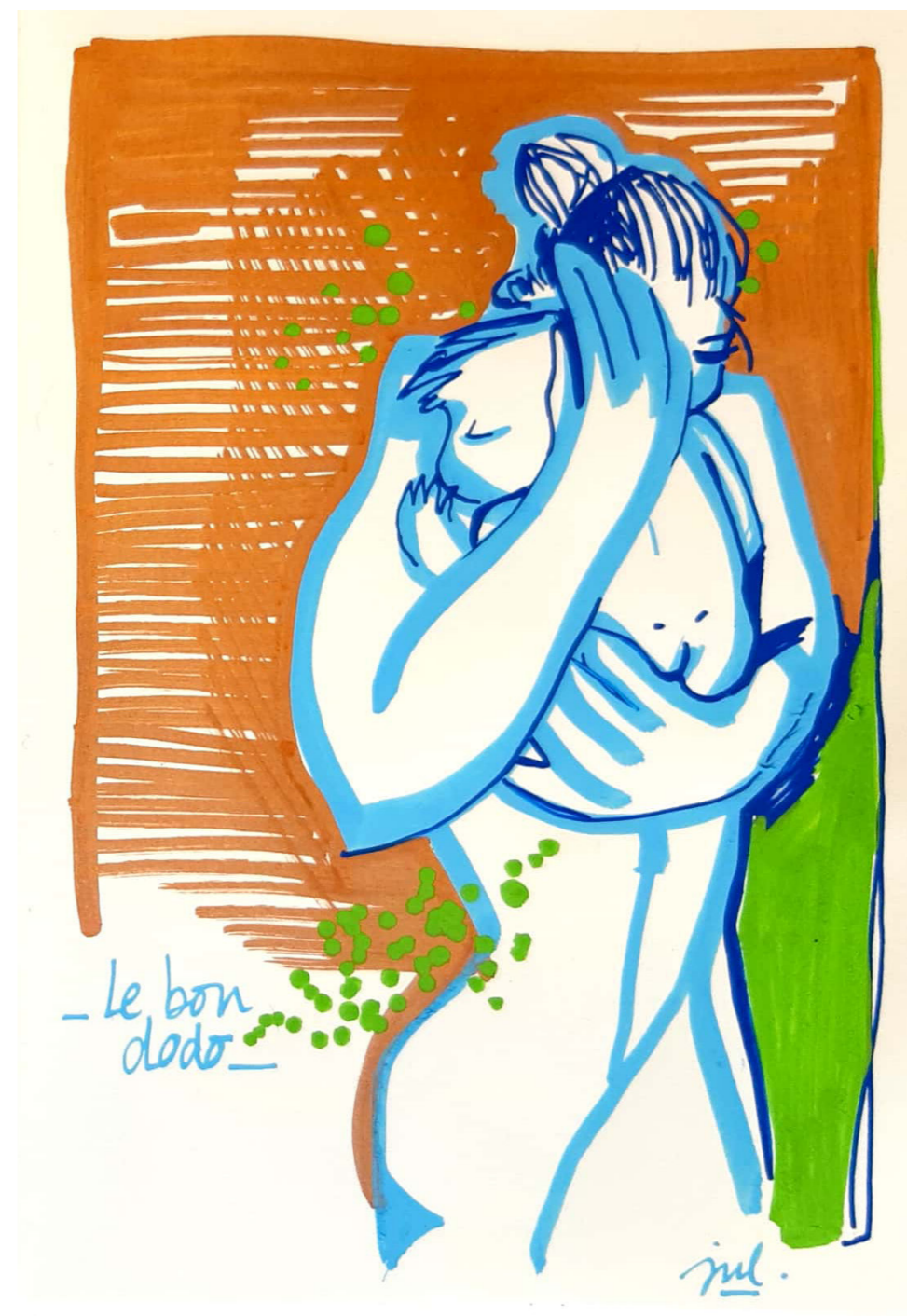
Le bon dodo, Gouache et acrylique sur papier, 15x10 cm, 2019.