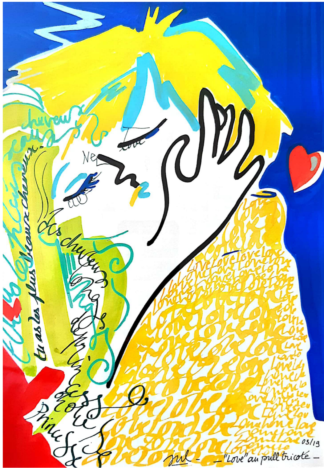
"Love" au pull tricoté, Encre de Chine et gouache sur papier, 40x30 cm, 2019.