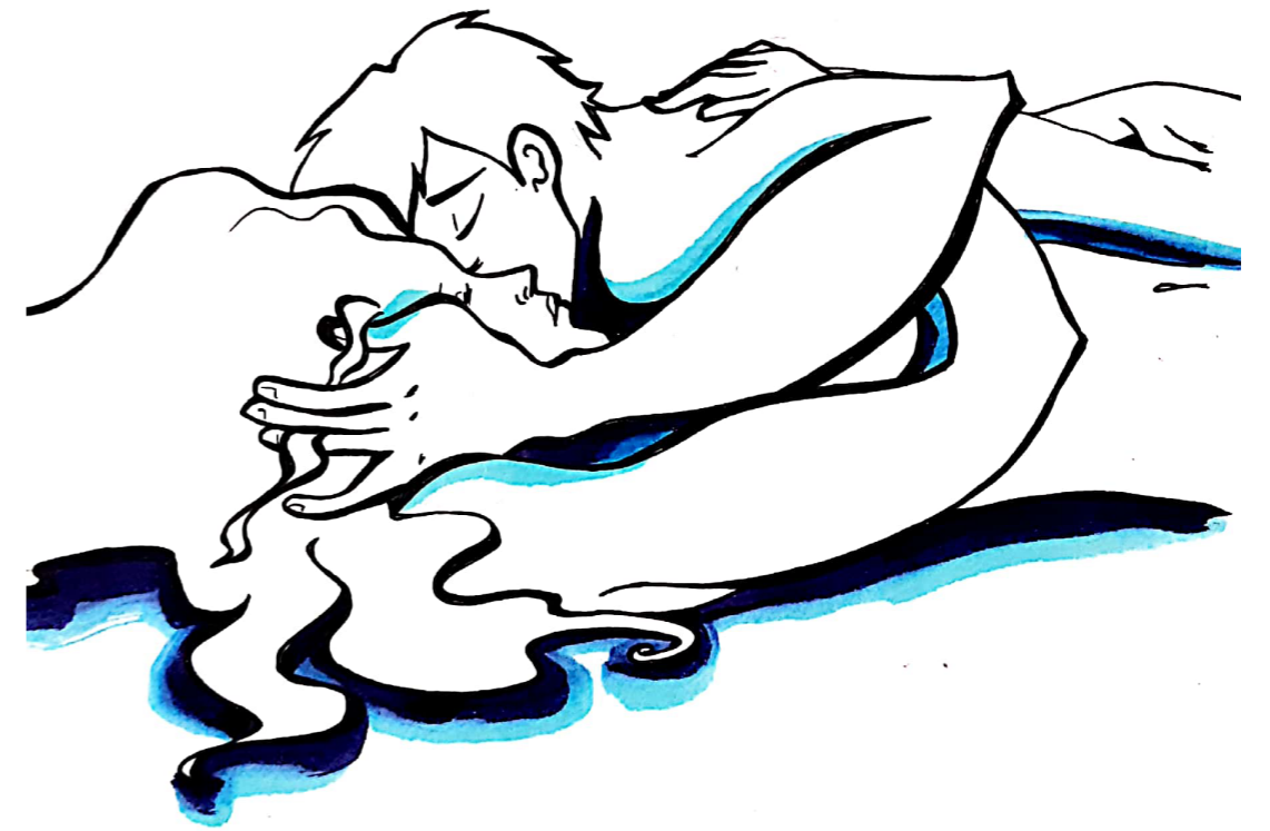
— Love — 03.2019 Jul.