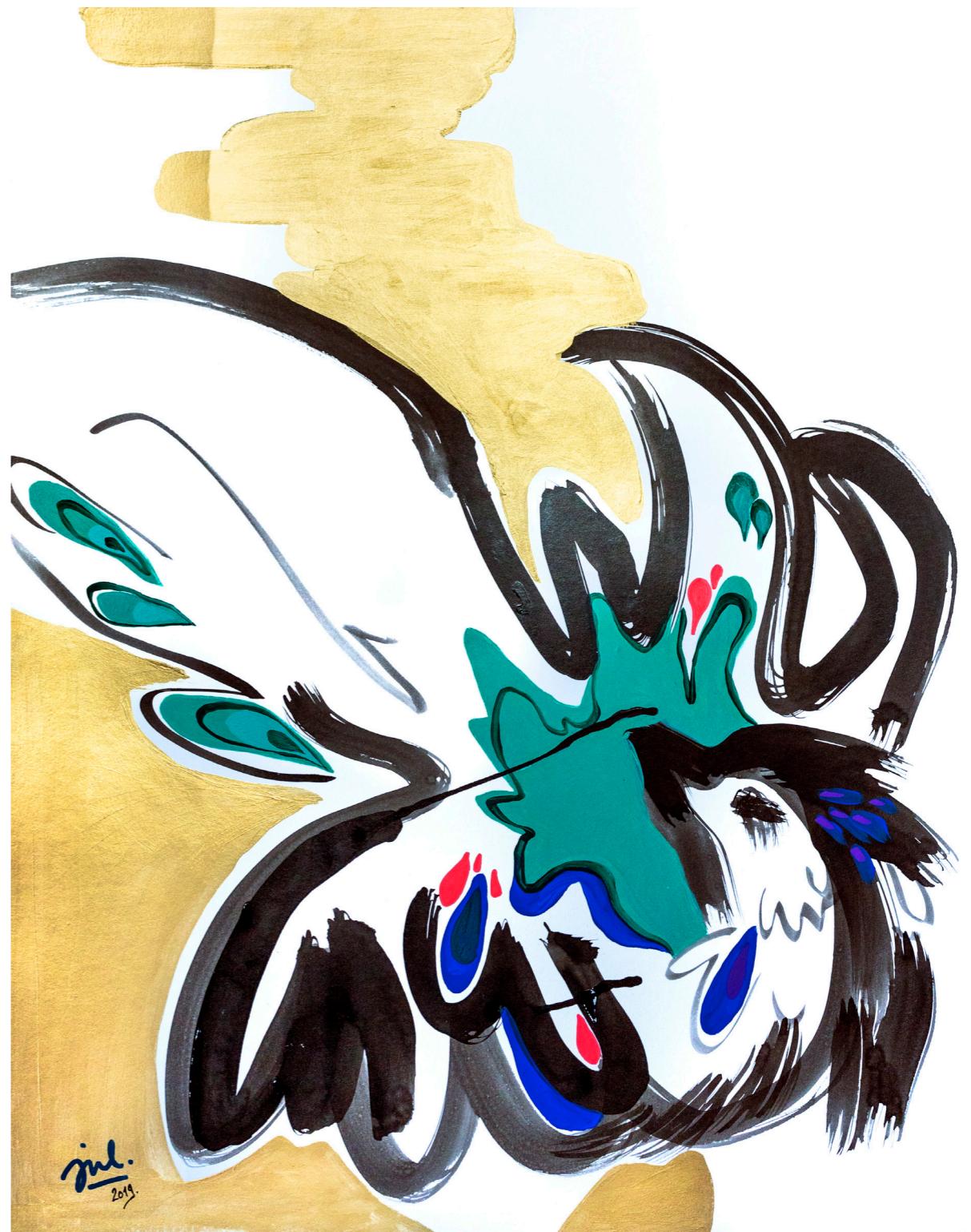
Colombe aux plumes de paon, Encre de Chine, acrylique et gouache sur papier, 80x60 cm, 2019.