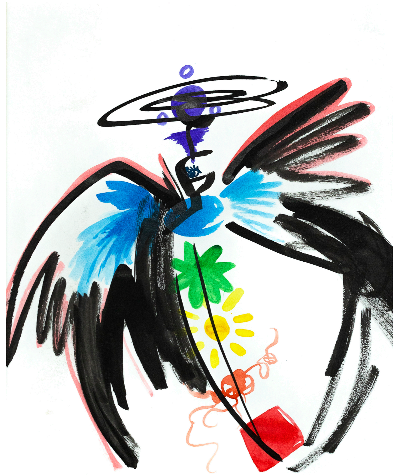
Ange aux sept chakras - 28105117 - jué.

Ci-contre : Ange aux sept chakras (7/15) Encre sur papier, 50x40 cm, 2017.